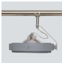
0010681 1 x QR111 35-75W